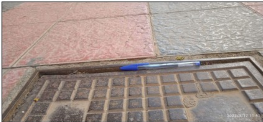
Foto 3. Resalto entre el marco y tapa de registro, equivalente al diámetro de un bolígrafo de la marca bic