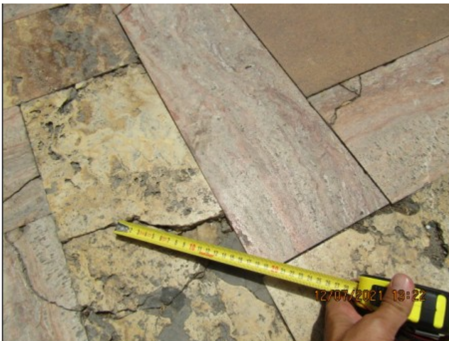
Foto 6. La irregularidad de la baldosa, en su diagonal, tiene una longitud de 12 cm.

CUARTO: Con fecha 30/08/2021 y 16/09/2021 y registro de entrada número 2021-E-RC-6898 y registro de entrada 2021-E-RC-7273 respectivamente se aporta documentación al expediente.