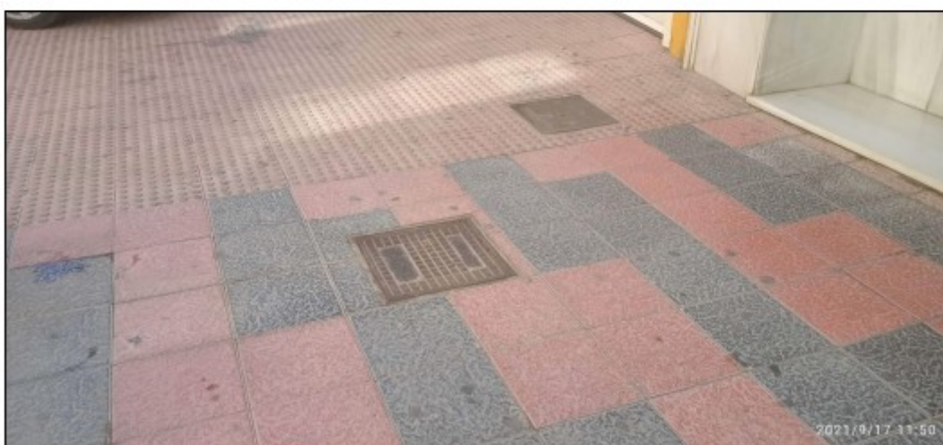
Foto 2. Arqueta de alumbrado público objeto del informe.