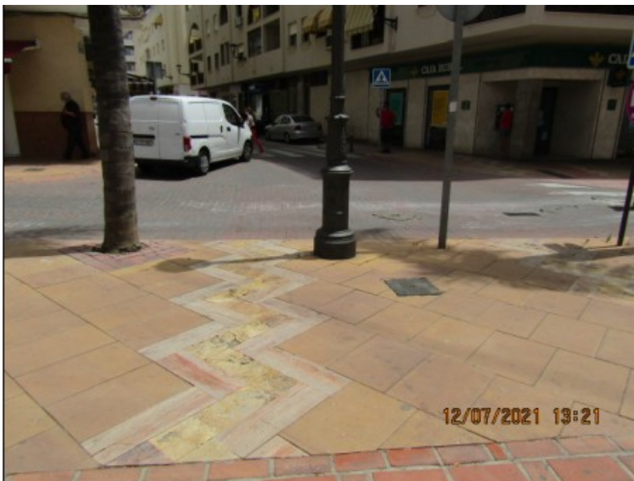
Foto2. Emplazamiento de la zona que indica el interesado en Avda Andalucía