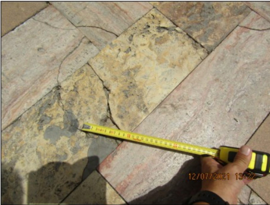
Foto3. Fractura y descascarillamiento de la baldosa de mármol travertino. Las dimensiones de esta patología en la superficie son de unos 10 cm