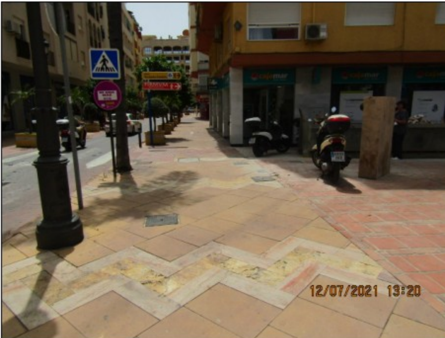
Foto1. Emplazamiento de la zona que indica el interesado en Avda Andalucía