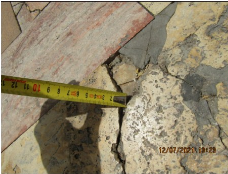
Foto5. El descascarillamiento del material, genera irregularidades de hasta 1,5 cm