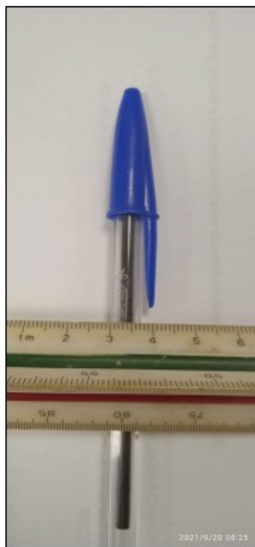
Foto4. Diámetro del bolígrafo de la marca BIC: 0,7 cm

QUINTO: Se emite Resolución de la Alcaldía 2021-3510 de 24 de septiembre de 2021 admitiendo a trámite la reclamación, notificada el 20 de octubre de 2021.