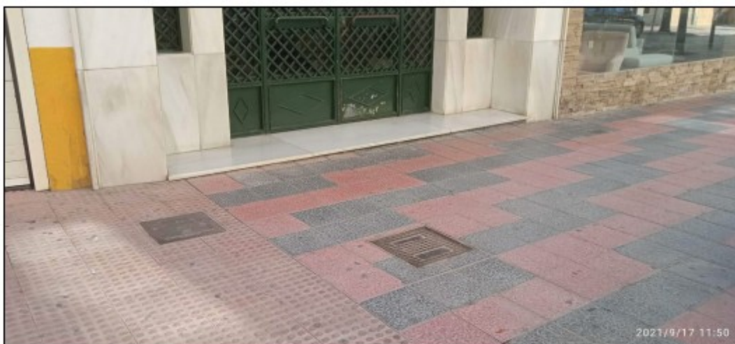
Foto 1. Arqueta de alumbrado público frente al portal nº 7 de Avda Europa.