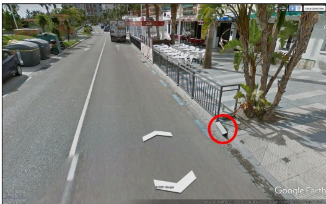
Imagen 1 Street View Google Earth Noviembre 2019 Bordillo suelto frente al alcorque

4. El bordillo, según las fotografías de archivo, tiene unas dimensiones aproximadas de 50x20x12 cm, suficientes y susceptibles de provocar un accidente si llega a invadir la calzada, hecho posible, ya que se encontraba suelto, sin sujeción alguna.