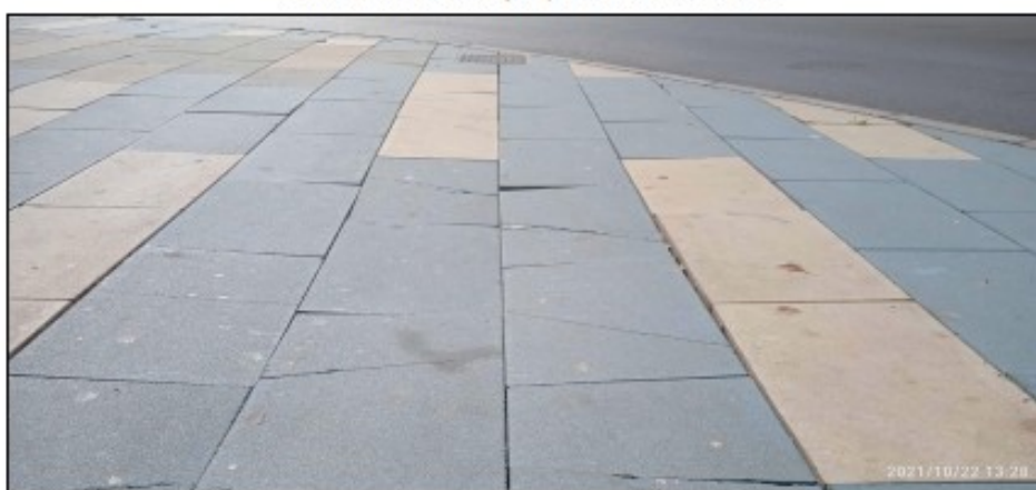
Foto2. Se aprecian leve hundimiento, resaltos y roturas en las baldosas. Sentido Sur (hacia la playa)