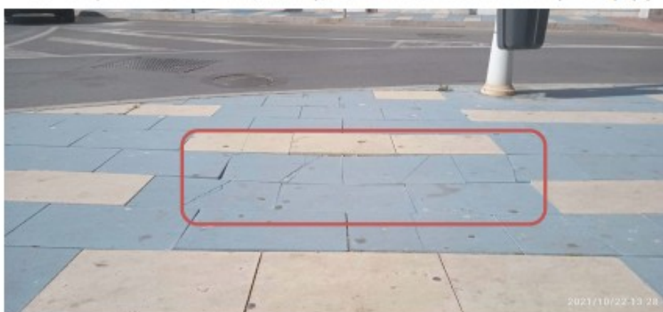
Foto3. Se aprecian leve hundimiento, resaltos y roturas en las baldosas. Sentido Oeste (hacia la playa)