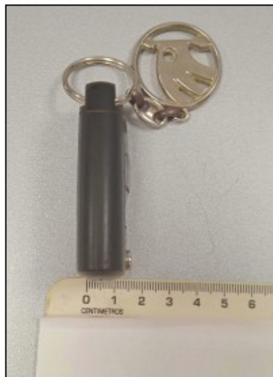
Foto 5. Comprobación del espesor situado sobre el resalto en la foto anterior.

Con fecha 16/11/2021 se dicta Resolución de Alcaldía 2021-3782 de admisión a trámite, notificándose la misma el 21/12/2021.