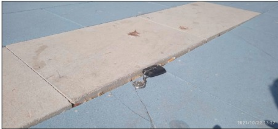
Foto 4. Medición del máximo desnivel generado entre baldosas. De aproximadamente 15 mm