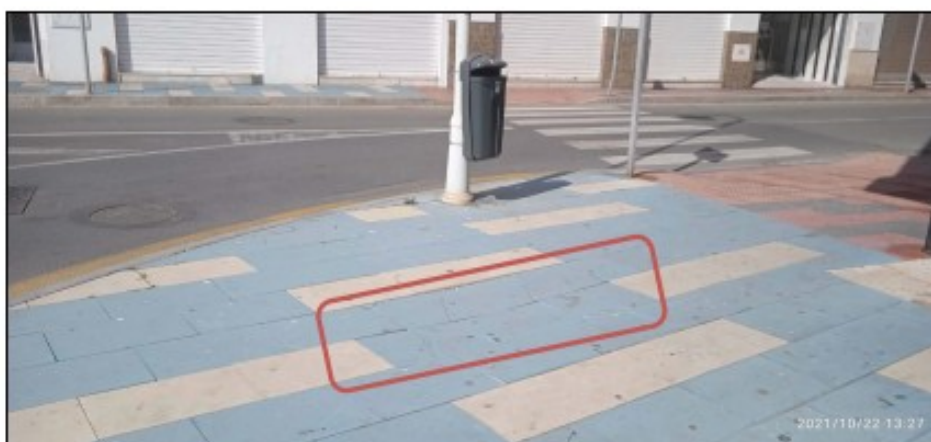
Foto1. Situación del lugar que el interesado indica