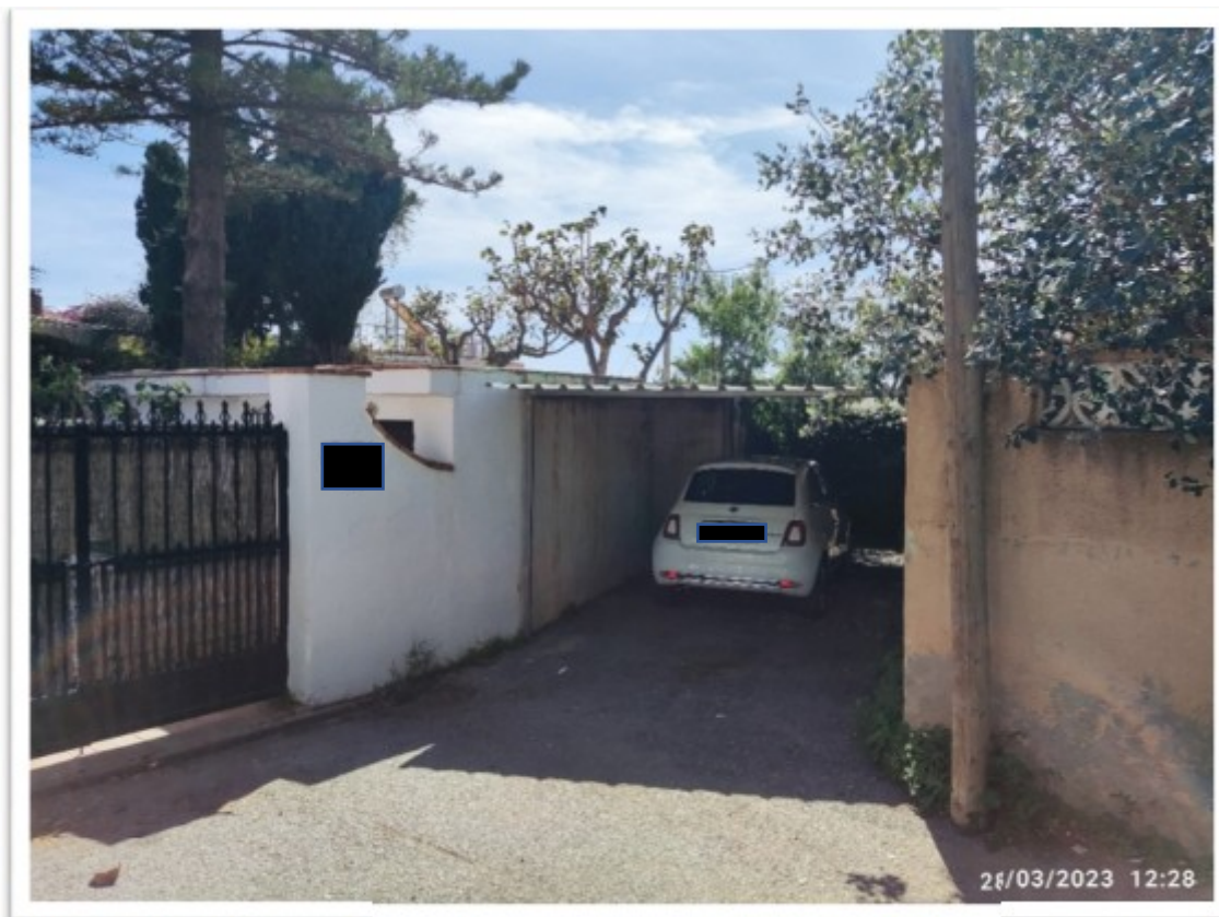
Vista de la zona ocupada exterior a la valla de cerramiento de la parcela [REDACTED] Fotografía de los Servicios Técnicos de Inspección de 28 de marzo de 2023.

obliga a acceder desde dicha zona empleada como aparcamiento a la citada parcela XXXX por el único portón con que la misma cuenta en su alineamiento con la calle Zurbarán.