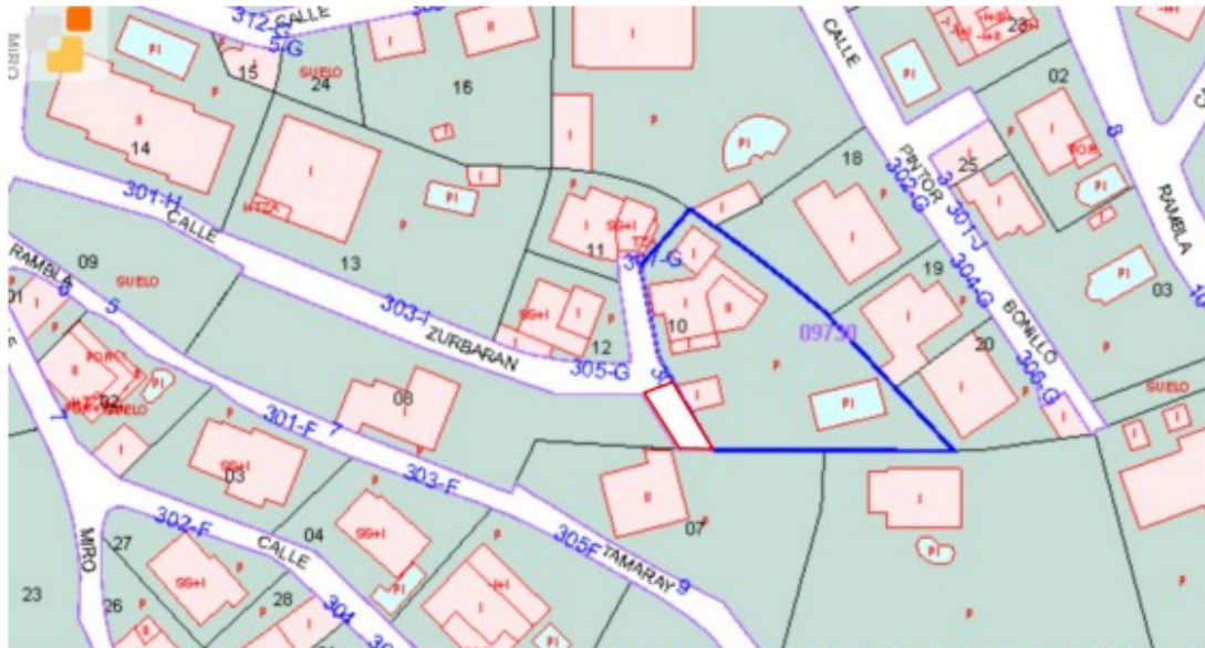
Extracto de la Sede Electrónica del Catastro: parcela 10 de la manzana 09750 en azul; en rojo, zona ocupada por la instalación con cubierta de chapa.

Junto a ello, debe insistirse que la finca catastral XXXX sobre la que se sitúa el inmueble no incluye la zona ocupada por la instalación con cubierta de chapa que nos ocupa, que aparece formando parte de la calle Zurbarán.