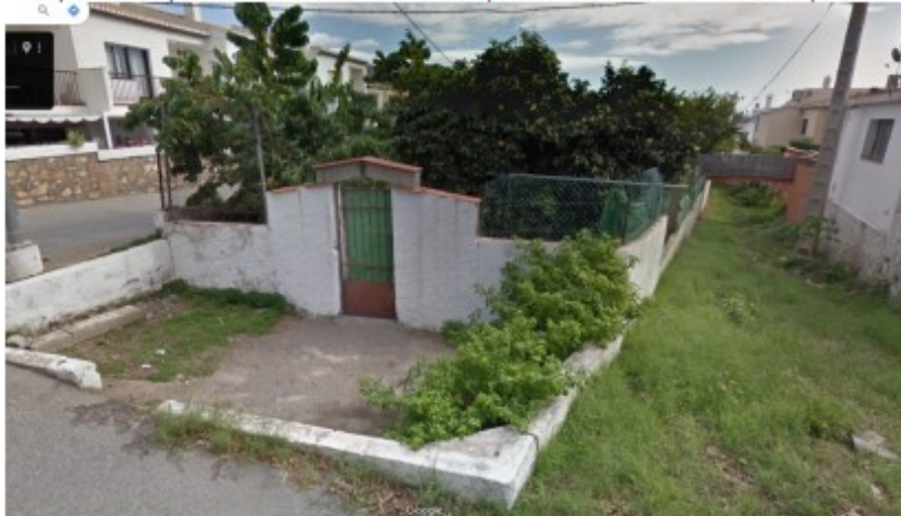
A la derecha, estado actual de la Rambla de Taramay –calle prevista del PGOU-87 de Almuñécar sin ejecutar-; a la izquierda inicio de la calle Zurbarán