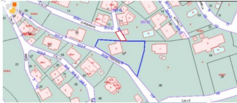
Extracto de cartografía catastral con indicación del emplazamiento de la parcela [REDACTED] (en azul) y delimitación de la zona ocupada por la instalación de aparcamiento cubierto (en rojo)