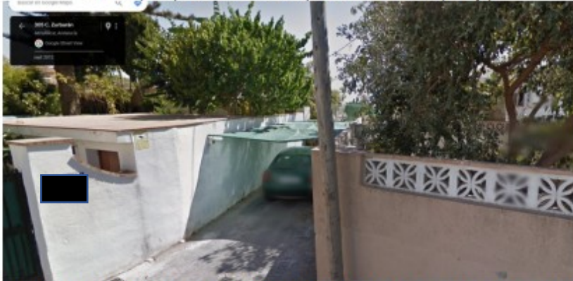
Zona que permite el acceso desde la calle Zurbarán a la parcela [REDACTED] a través del ámbito ocupado por el sombrero que se emplea como aparcamiento. Al fondo de la zona ocupada se observa el límite de la citada parcela.